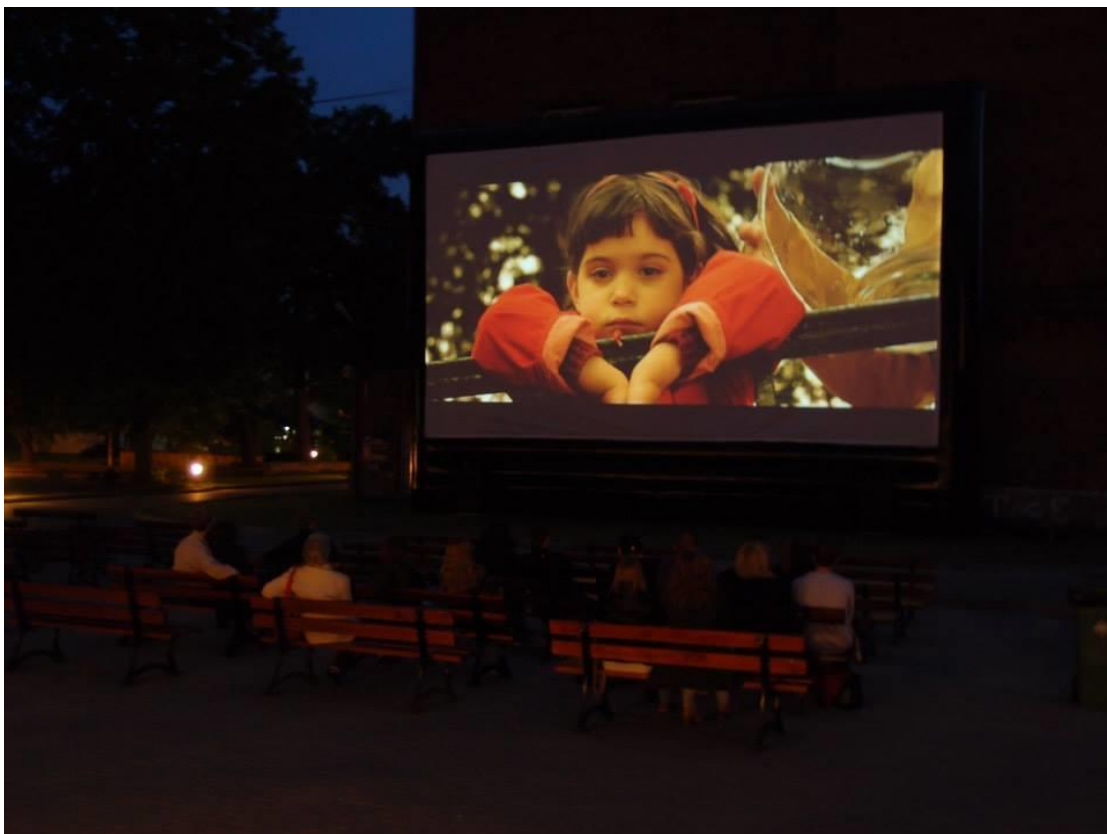
Kino Letnie na wielkim ekranie w Szkole Filmowej w Łodzi