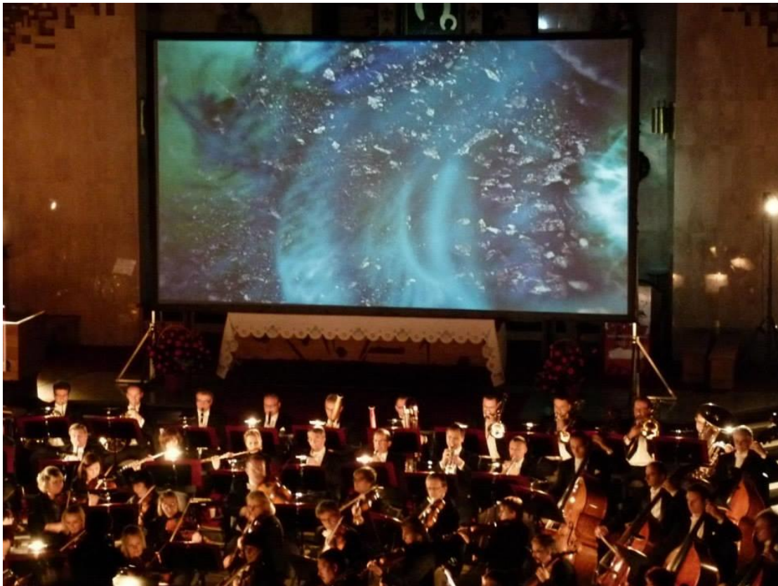
Obchody 40-lecia Szkoły Muzycznej w Zduńskiej Woli – gość specjalny Stanisław Syrewicz