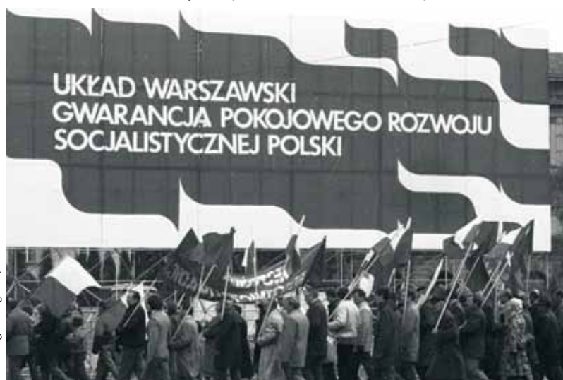
Warszawa, obchody święta 1 Maja 1985

Kluczowe dla „odnowienia” spojrzenia na PRL jest zrozumienie motywów działania jednostek i dużych grup społecznych, zarówno w poszczególnych etapach dziejów Polski Ludowej, jak i podczas kolejnych przełomów. Dlaczego znaczna część społeczeństwa zaakceptowała nowy system? Co, oprócz przemocy i terroru, zaoferowały obywatelom władze? Dlaczego z taką determinacją protestowali robotnicy Poznania? Dlaczego Gomułce śpiewano „Sto lat!”? Co oznaczało zadane przez Wojciecha Młynarskiego pytanie „W co się bawić”? Skąd wzięło się uwielbienie dla Edwarda Gierka, a skąd bezprecedensowa masowość prote-