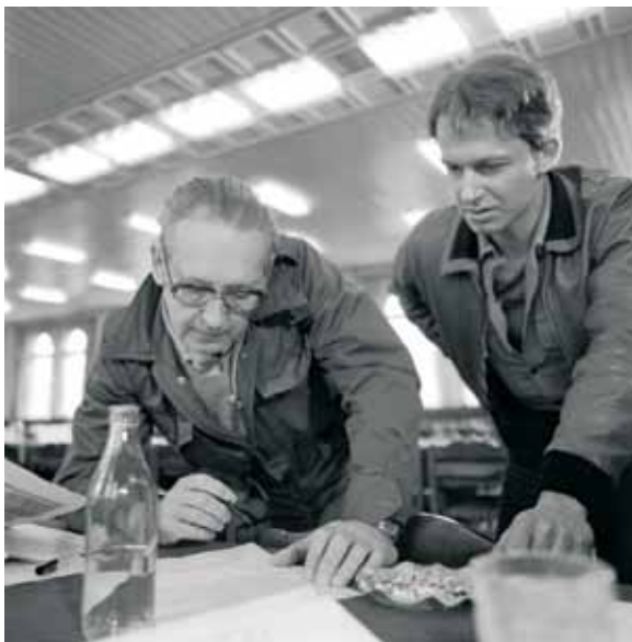
Andrzej Wajda i Bogusław Linda Plan filmu Człowiek z żelaza , Gdańsk, wiosna 1981

Dzieło Krauzego jest rzadkim przykładem współczesnego kina historycznego, które przekonująco, drobiazgowo ukazuje dramatyczne wydarzenia bez ubierania ich w nieznośnie patetyczny, ideologiczny kostium, a jednocześnie nie epatuje widza banałem wyciskających łzy romantycznych wątków. Film ze wszech miar godny polecenia.