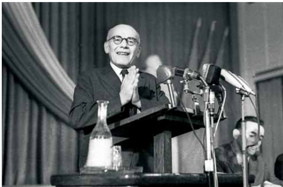
Spotkanie aktywu w KC PZPR z Władysławem Gomułką, Warszawa 1963

polityki Stalina, staje się idealnym kandydatem na I sekretarza. Zostaje nim 19 października 1956 roku, po krótkim nieporozumieniu i nieoczekiwanej wizycie w Warszawie Nikity Chruszczowa, nowego przywódcy KPZR. Objęcie przez niego władzy jest obietnicą „nowego otwarcia”, weryfikacji dotychczasowych haseł, odwilży gomułkowskiej i początkiem tzw. „małej stabilizacji”.