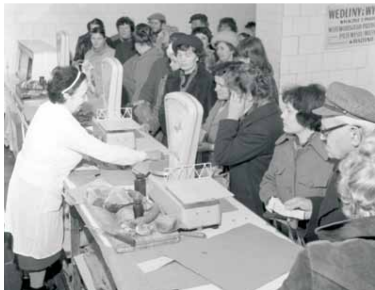
Sprzedaż mięsa na kartki, Olsztyn 1981